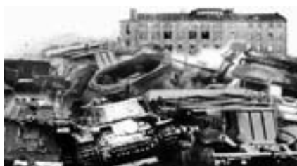
Siluetu droždárny Na Bramšy, tolik typické pozadí na předválečných fotografiích fotbalistů TFK 03. Původní hřiště sloužilo po květnu 1945 také jako skladiště zabavené a na útoku opuštěné německé vojenské techniky, dnešní poslání je rovněž nanejvyšší prozaické - parkoviště supermarketu...