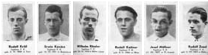
fotografie hráčů TFK 03 z alba čokoládovny Libo