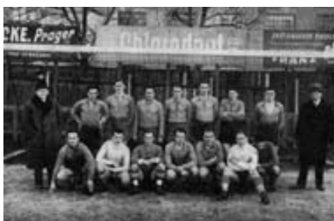
TFK 03 z roku 1931