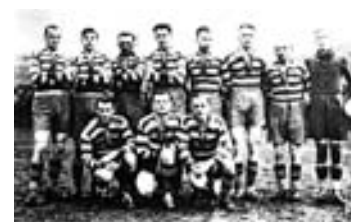
Velký konkurent městského rivala TFK 03 - tepličtí z VfB ve třicátých letech