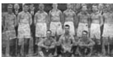
Teplický VfB z dvacátých let