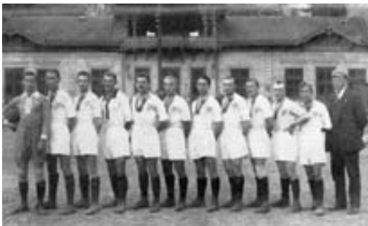
Foto týmu ze sezóny 1925/26